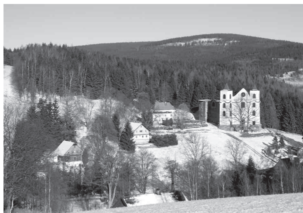
Obr. 2. – Kostel Nanebevzetí Panny Marie: a – před válkou, b – v listopadu 2003, v pozadí Bystřické hory, Polsko.

Se změnami ve využití půdy se měnil i krajinný pokryv. Z obhospodařované a kulturní krajiny se postupem času stala krajina opuštěná, zanedbaná. Bylo tak dáno více prostoru přírodě, i když rozhodující vliv tu stále měl člověk. Vlhčí stanoviště podél malých potočků, převážně někdejší louky, spontánně zarostly olšemi, sušší místa, zejména někdejší pole, byla zalesněna nebo přeměněna na louky či pastviny. Stádia zarůstání lesem dokumentují letecké fotografie z 50. – 60. let. Pionýrské dřeviny, jako bříza a jeřáb se na takových místech snadno uchytí a postupně se odtud mohou šířit do neobhospodařovaných ploch. V Neratově kamenné valy po válce pohřbil les, ale na stráních Černého vrchu takto vznikly zajímavé heterogenní struktury. Postupně dochází k homogenizaci krajiny a zvyšuje se neprostupnost matrice (cf. Guth a kol., 1995). Od r. 1996 krajina doznala dalších změn. Kromě velké pastviny v jižní části osady (v r. 1996 to byla louka), na které se ve vegetačním období pase masné plemeno skotu, už v Neratově žádné jiné pastviny nejsou. Využití luk pro pastvu je poměrně dynamické a odpovídá aktuálním potřebám, oproti minulosti je obecně rozloha pastvin nižší.